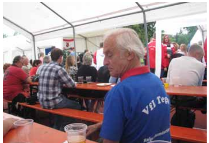
Udo sucht auch