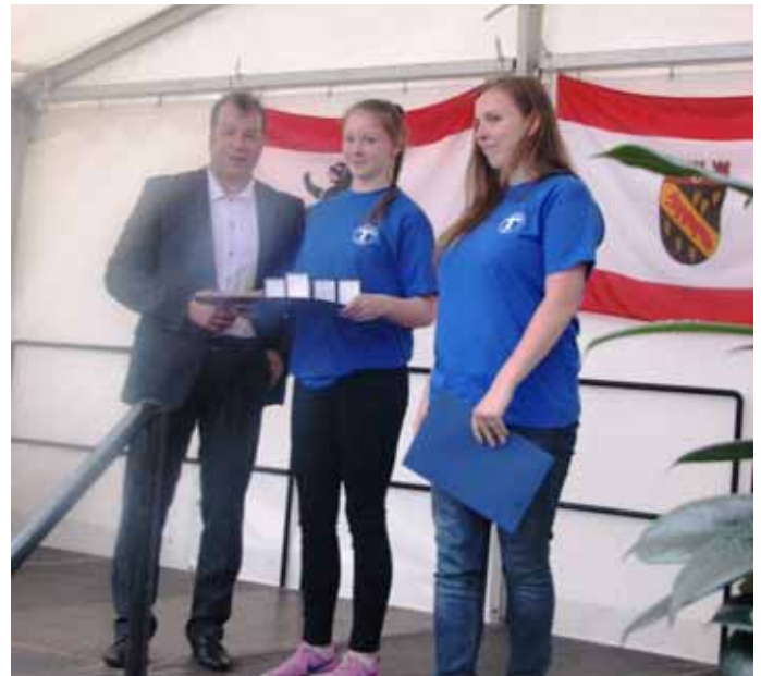
Tischtennis: 2 Bronze-, 2 Silber- und eine Goldplakette