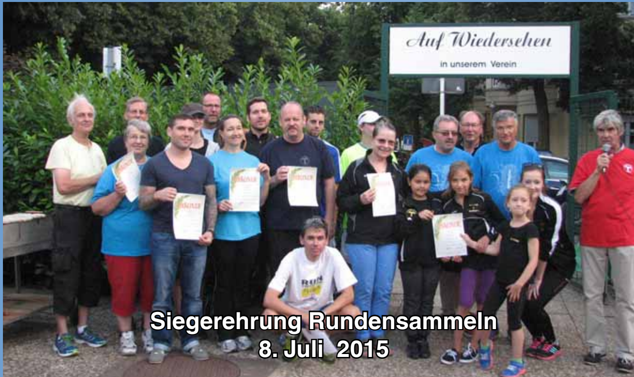
Siegerehrung Rundensammeln 8. Juli 2015

Verein für Leibesübungen Tegel 1891 e.V.