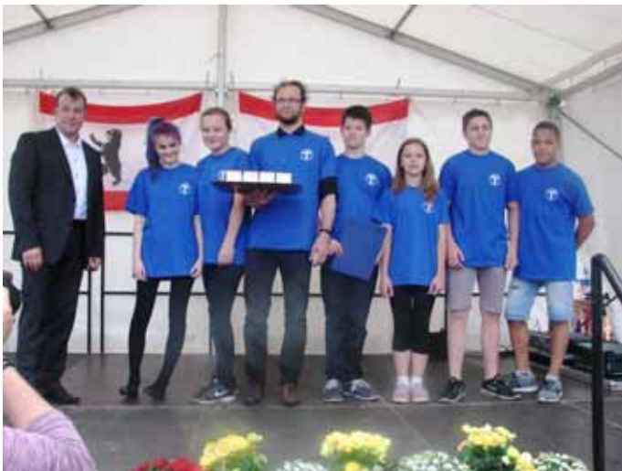
4 Bronze, 1 Silber und 3 Goldplaketten für die Ringer