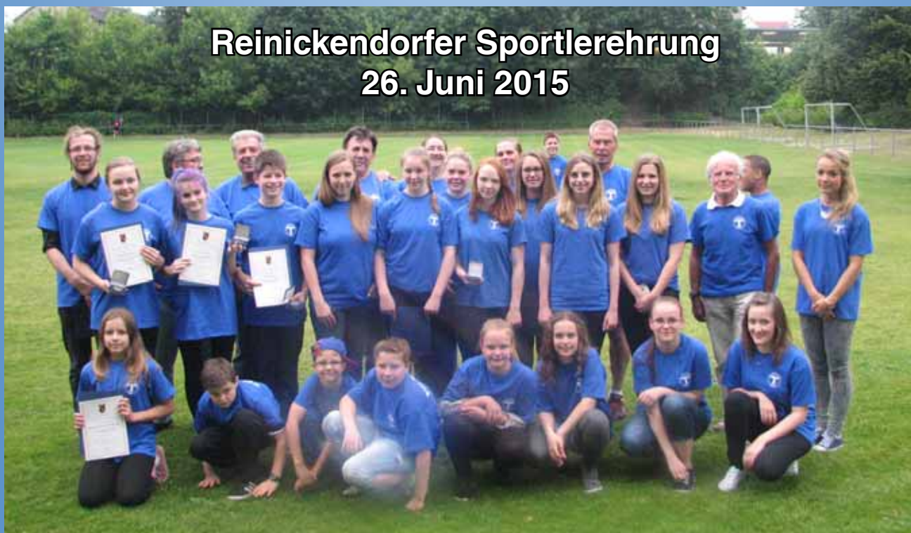
Reinickendorfer Sportlerehrung 26. Juni 2015