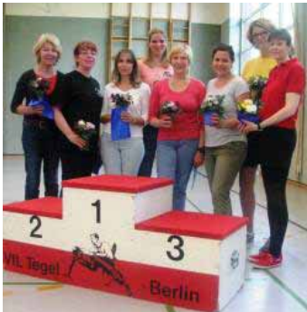
Sie stehen hinter den Ringern (Siegerpodest), die engagierten Sportlehrerinnen der fünf Schulen