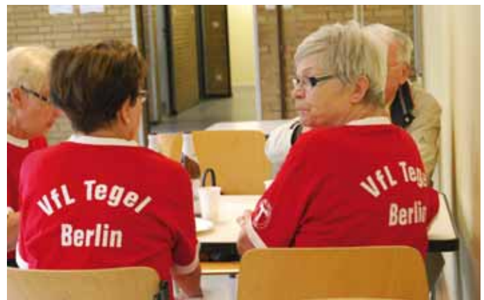
Der Vorstand bedankt sich bei den zahlreichen Helfern

Vom 14. bis 17. Mai 2015 trafen sich in den Sporthallen (Sportpalast und TBW) Tischtennispieler aus Berlin, Deutschland und Europa, um ihre Meister in 16 verschiedenen Klassen auszuspielen. Der TT-Sport stand für vier Tage im Mittelpunkt des Geschehens. Mit einer Rekordteilnehmerzahl von über 800 Aktiven zählt die Veranstaltung weiter zu den großen und wichtigen Tischtennisturnieren