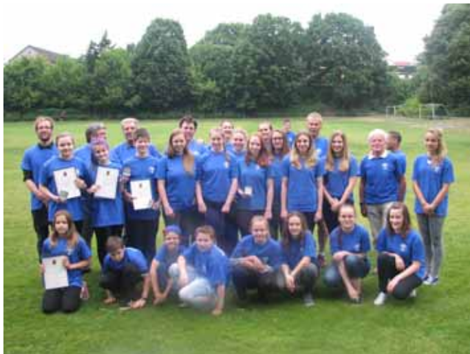
(VfL Tegel mit Sportler, Trainer und Betreuer)