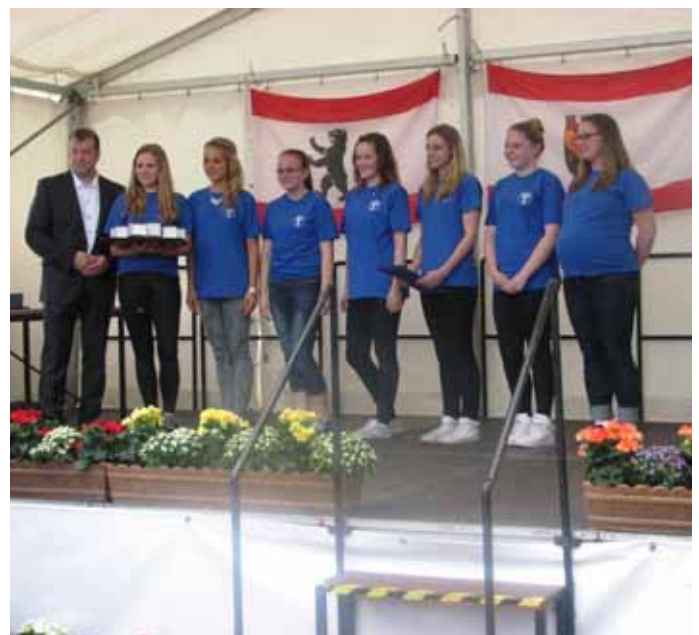
Twirling: 12 Goldplaketten für die Deutschen Meisterinnen 2014