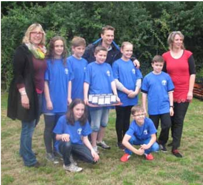
10 Bronzeplaketten für die Floorballer mit Trainer und Betreuer