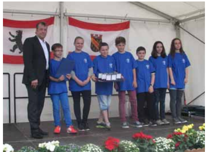
Turnen: 1 Bronzeplakette vom Bürgermeister